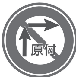
二段階右折の標識