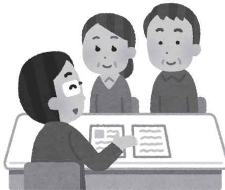
納得いくまで相談しよう!